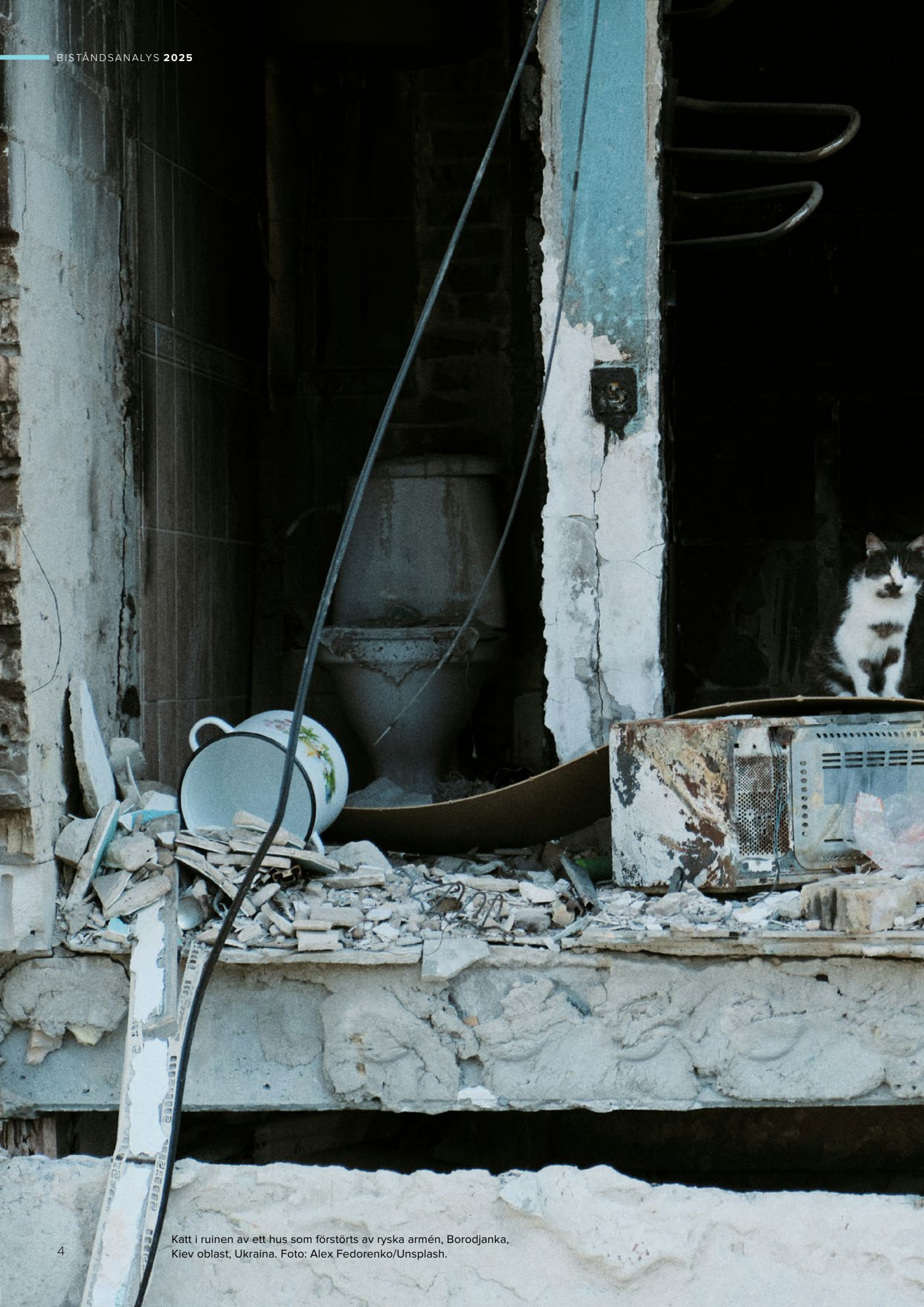
Katt i ruinen av ett hus som förstörts av ryska armén, Borodjanka, Kiev oblast, Ukraina.