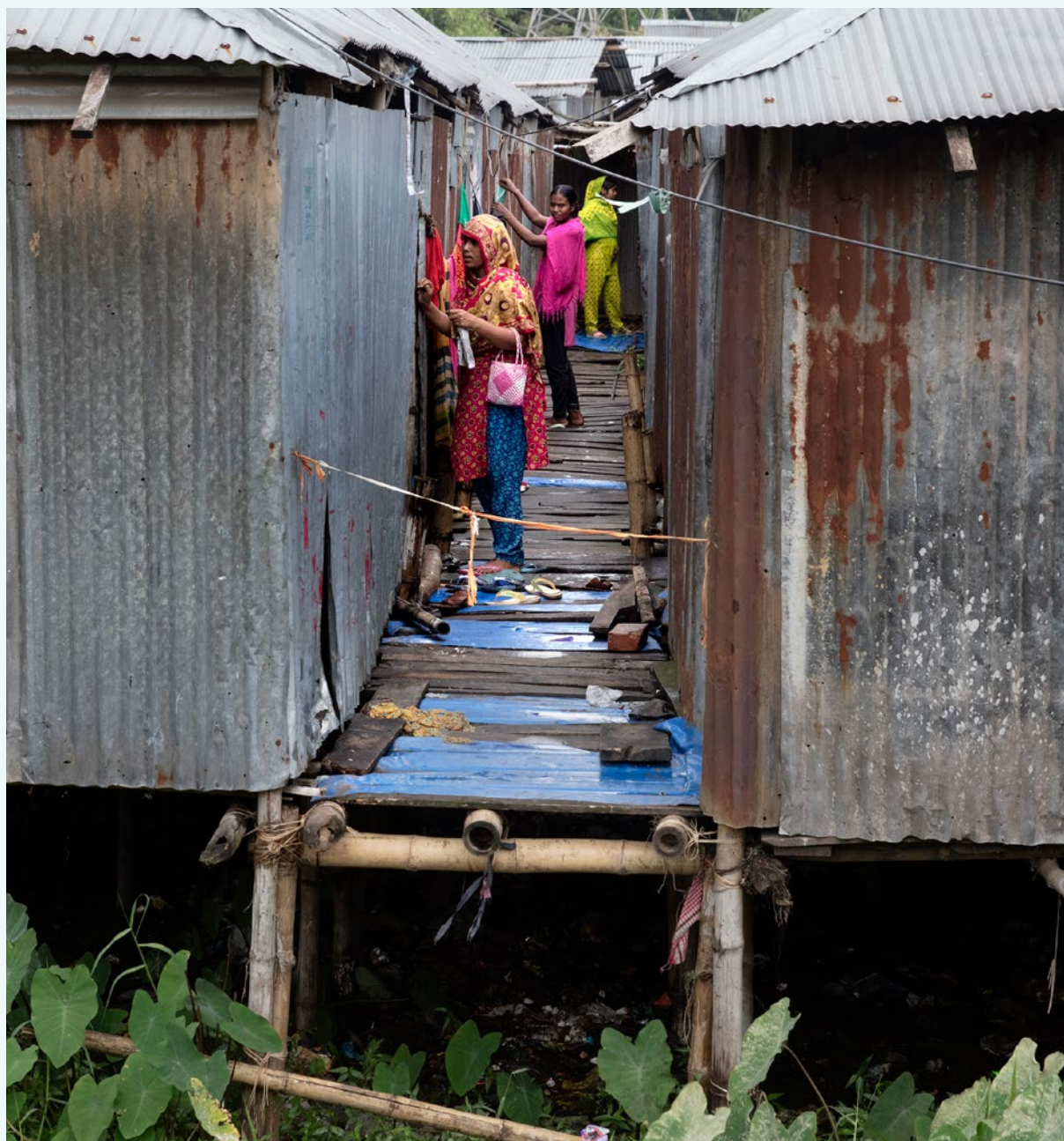
Vardag för invånare i slumområdet Sujat Nagar i Dhaka, Bangladesh.