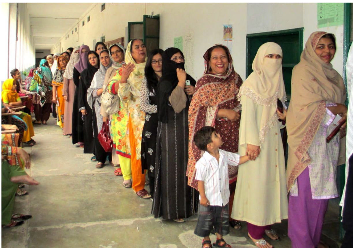
Kvinnor från Rawalpindi väntar på att få rösta i det pakistanska valet.