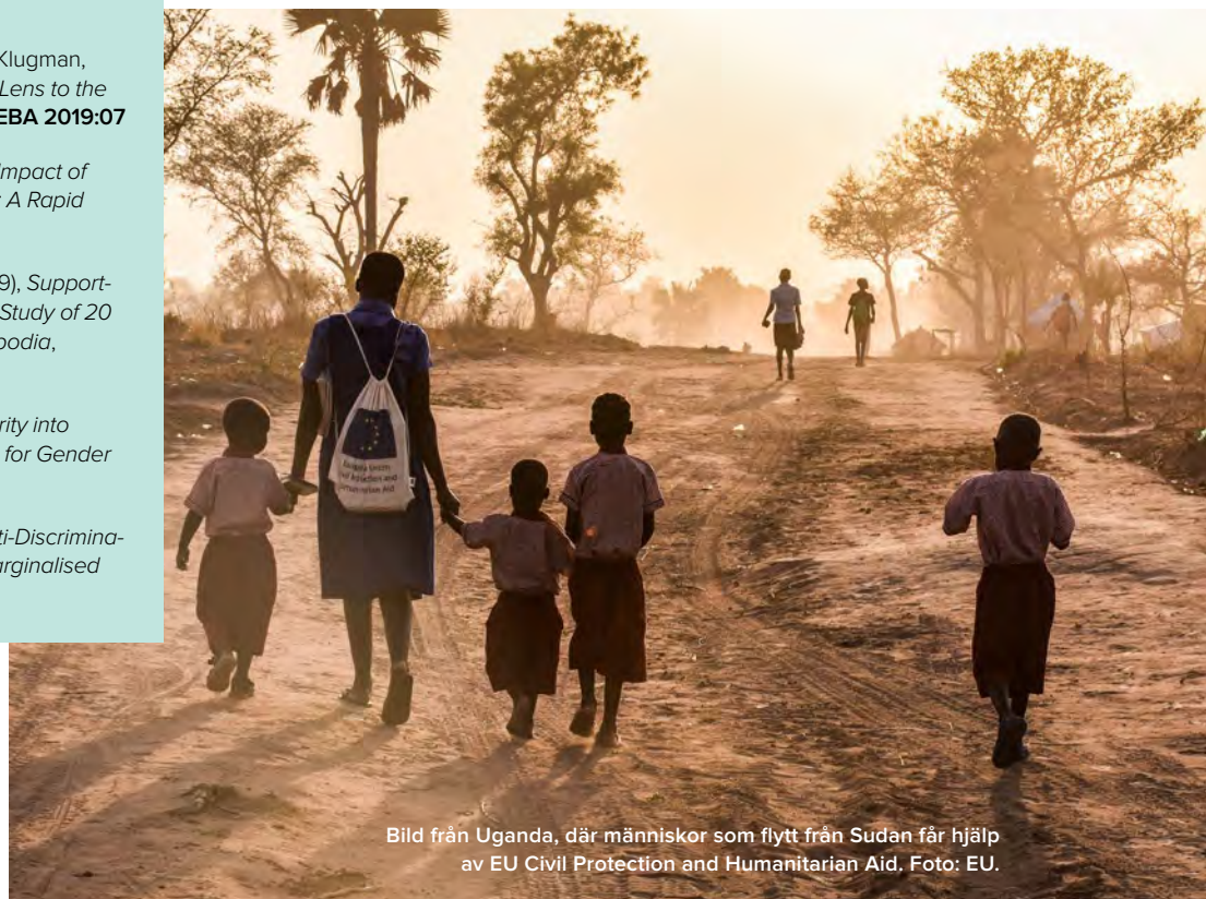
Bild från Uganda, där människor som flytt från Sudan får hjälp av EU Civil Protection and Humanitarian Aid.

R. Marcus, A. Mdee, E. Page (2017), Do Anti-Discrimination Measures Reduce Poverty among Marginalised Social Groups , EBA 2017:02