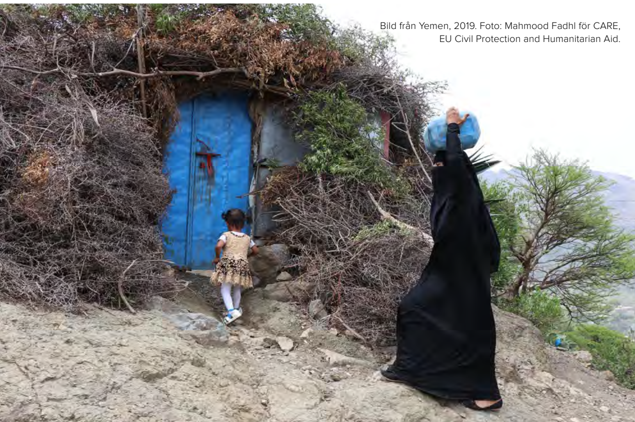
Bild från Yemen, 2019.

resultat växlas med perioder präglade av tillit, lärande och partnerskap ( EBA DDB 2018:02 ). Var tids bistånd har sina utmaningar och den nuvarande inriktningen mot sviktande miljöer, konflikt och humanitära situationer kan innebära större risktagande inom alla tre kategorier som nämnts här.