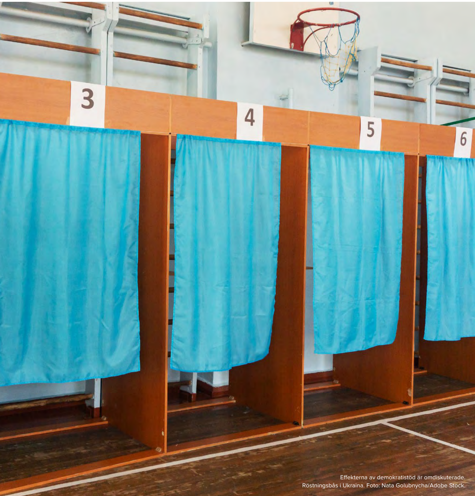
Effekterna av demokratistöd är omdiskuterade. Röstningsbås i Ukraina.