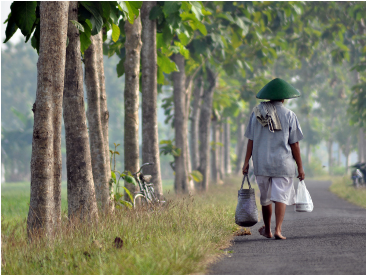
På väg till risfälten en tidig morgon i byn Maos, Indonesien.