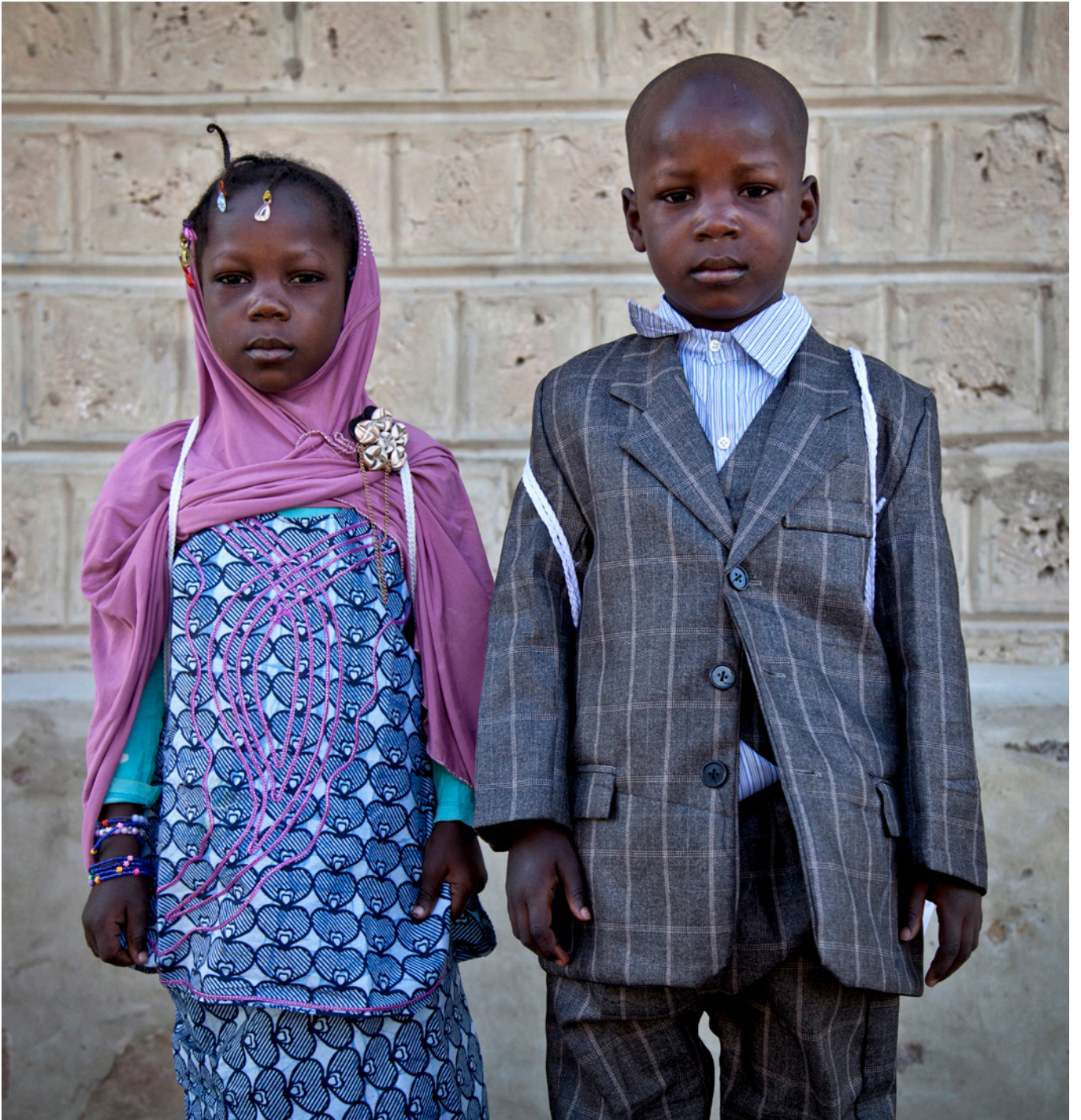
Två barn på väg till skolan i Timbuktu, Mali.