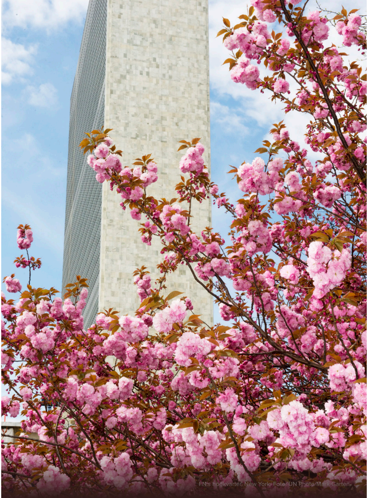
FN:s högkvarter, New York.