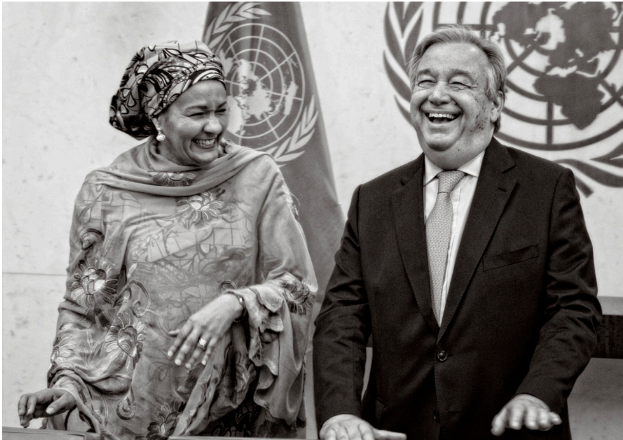
FN:s nye generalsekreterare António Guterres och biträdande generalsekreterare Amina J. Mohammed, första dagen på sina nya poster, januari 2017.