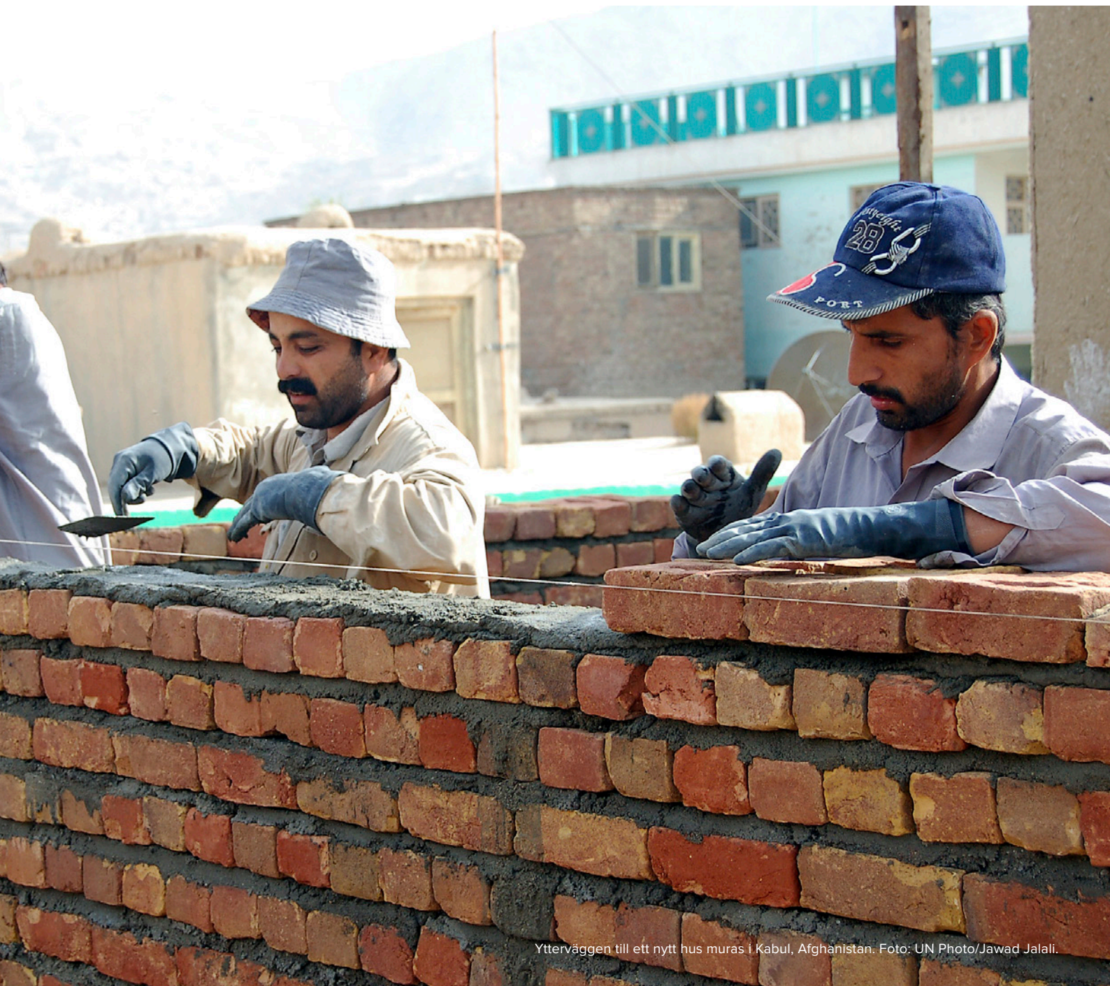
Ytterväggen till ett nytt hus muras i Kabul, Afghanistan.