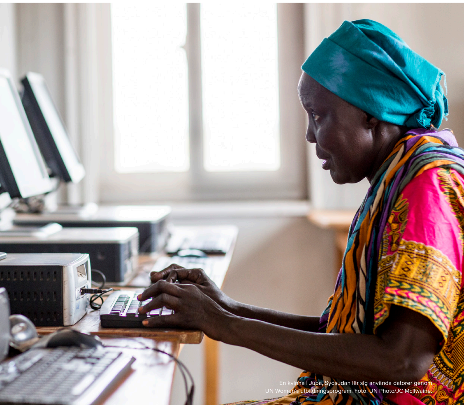
En kvinna i Juba, Sydsudan lär sig använda datorer genom UN Women's utbildningsprogram.