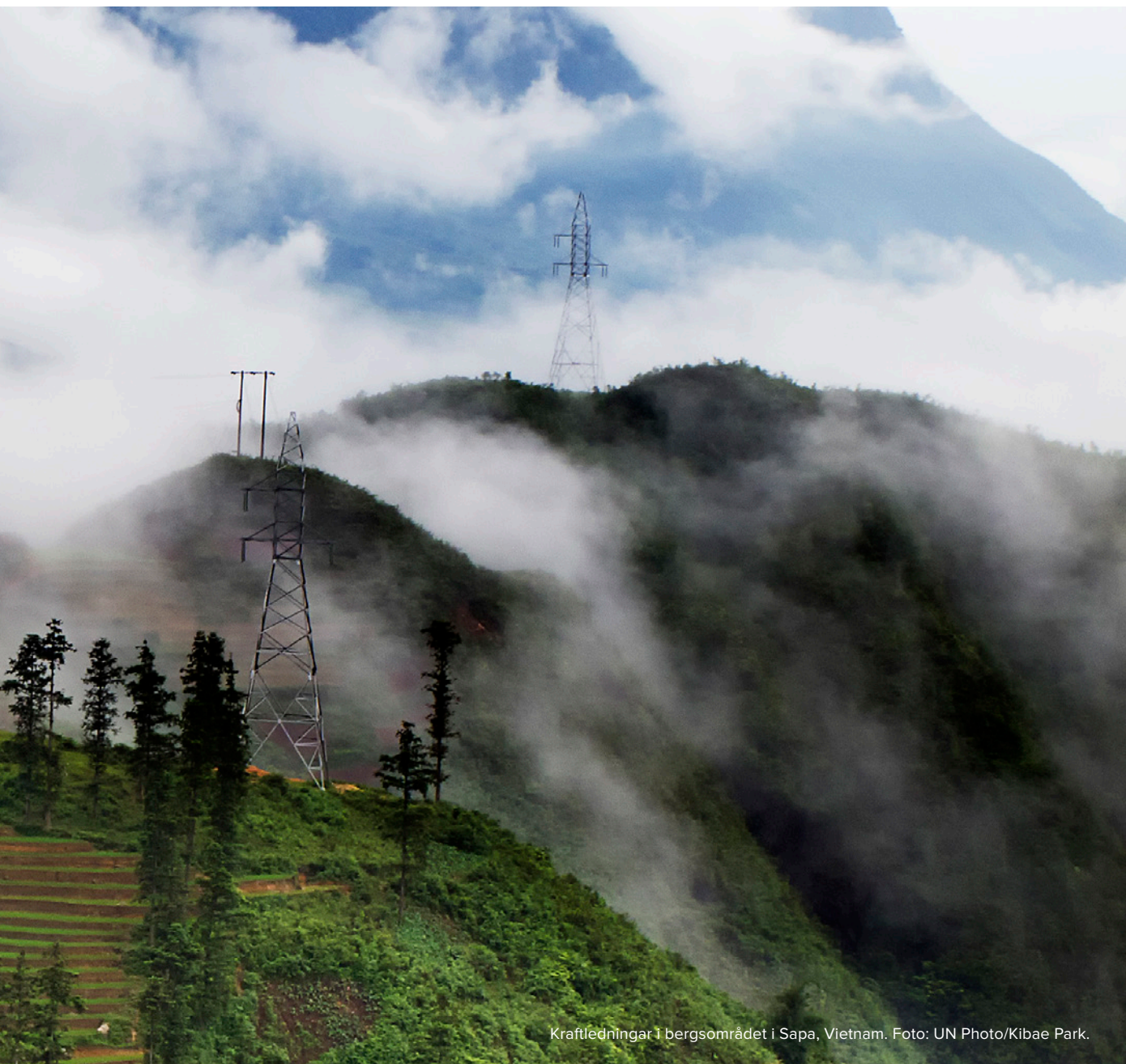
Kraftledningar i bergsområdet i Sapa, Vietnam.

tanzaniska staten”, anser författarna (s. 10). Kruse ( EBA 2016:09 ) noterar att det årliga svenska biståndet till Uganda – som i volym motsvarar kostnaden för att bygga en mellanstor bro i Skandinavien – bedrivs i många små insatser för att stärka demokrati, öka sysselsättning, förbättra grundläggande hälsa, värna mänsklig säkerhet och ta hänsyn till övergripande frågor som diskriminering av marginaliserade grupper, jämlikhet, könsbaserat våld, med mera. I båda landrapporterna argumenteras för att Sverige mer aktivt bör koncentrera biståndet genom ökad samordning med andra givare.