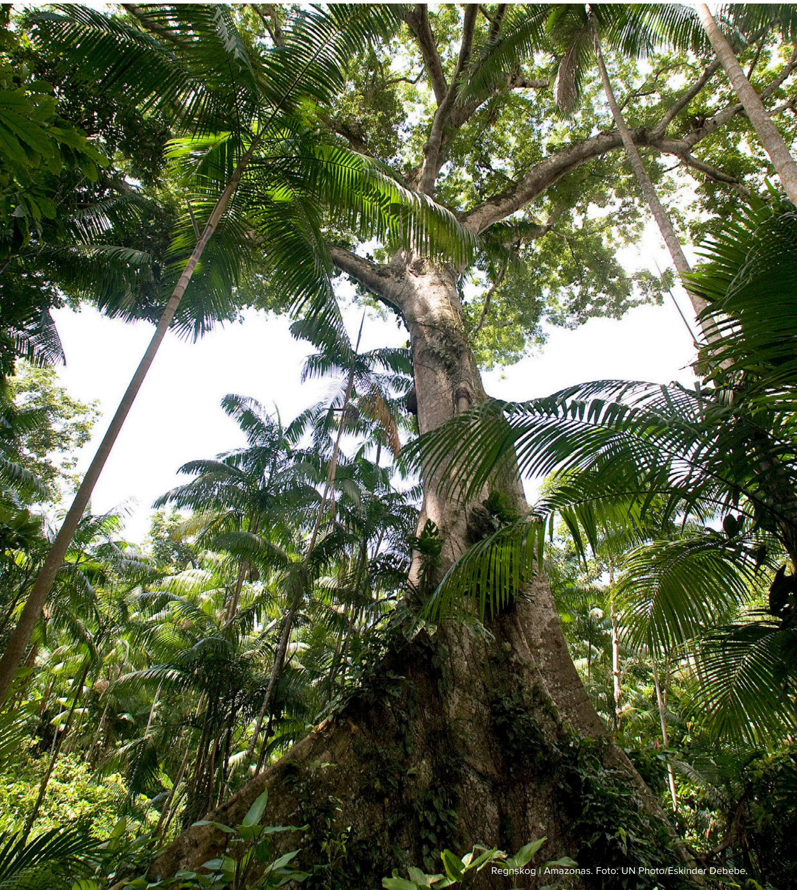
Regnskog i Amazonas.