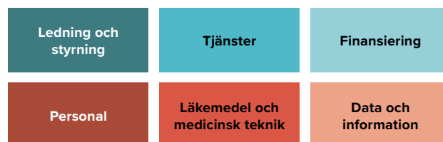
Figur 1. Byggstenar i ett hälsosystem