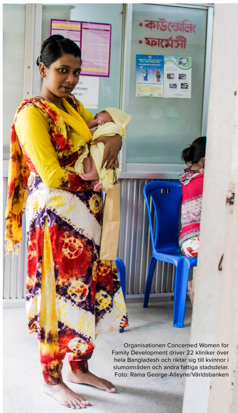
Organisationen Concerned Women for Family Development driver 22 kliniker över hela Bangladesh och riktar sig till kvinnor i slumområden och andra fattiga stadsdelar.