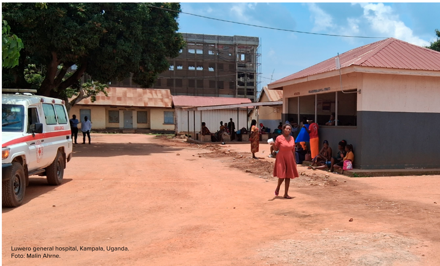
Luwero general hospital, Kampala, Uganda.

Utvärderingen pekar på behovet av ett mer